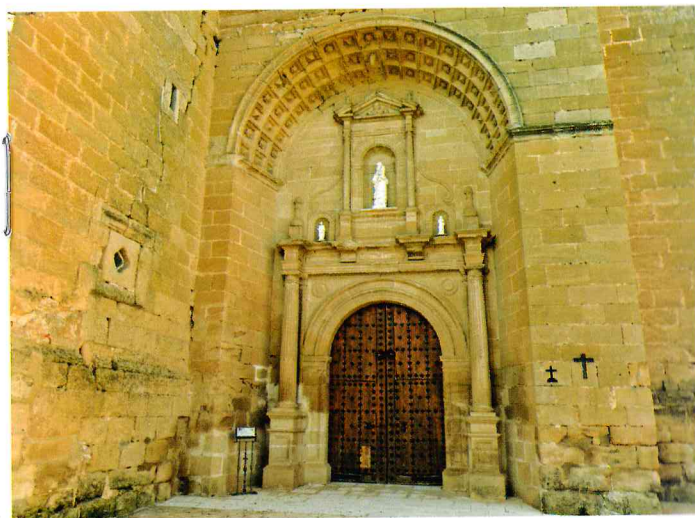
Pórtico de la Iglesia de Garcinarro

Sus alrededores parecen inventados para el senderismo. Un itinerario sencillo y sorprendente es la Ruta de las Caras, que recorre un camino repleto de esculturas de grandes dimensiones labradas en la roca.