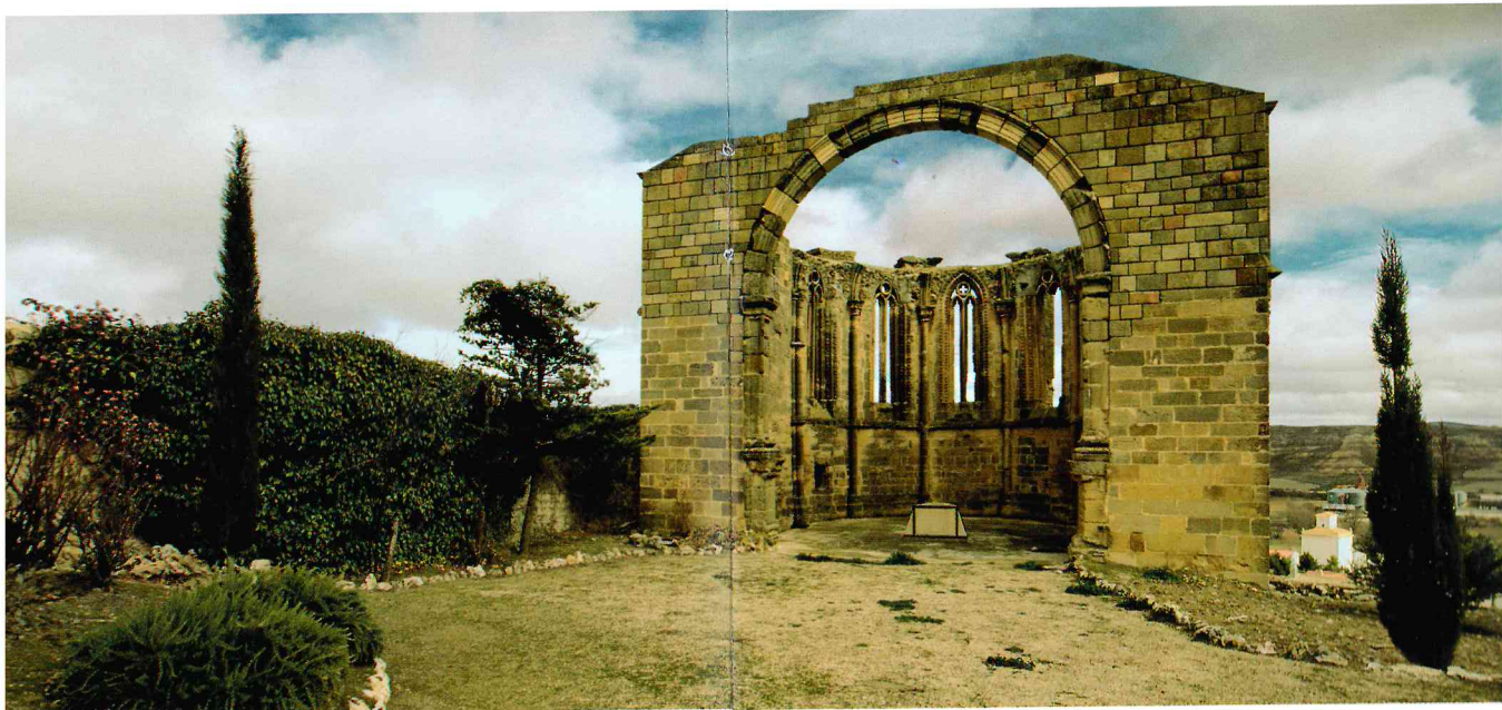
Iglesia de Santa María de Atienza, Huetes

El ábside de Santa María de Atienza data del siglo XIII y es una singular muestra arquitectónica del estilo gótico