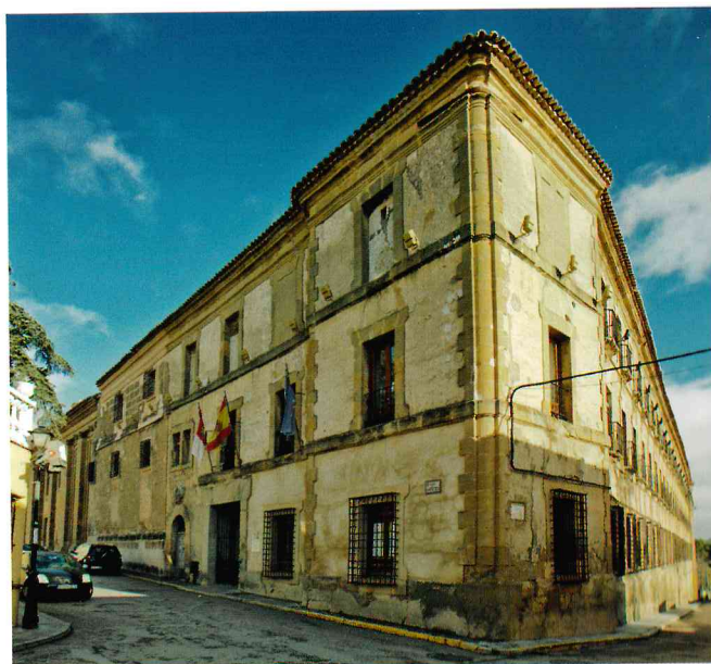
Monasterio de Nuestra Señora de La Merced, Huete

Hay localidades donde la historia y el arte no son una excepción consagrada a algún edificio refugiado en una isla monumental sino que constituyen su esencia y acaban por impregnar cada detalle de su paisaje urbano. Es el caso de Huete , en plena Alcarria, que conserva las muestras de su condición de influyente ciudad sobre un vasto territorio. Cada civilización ha dejado su legado hasta configurar un conjunto único repleto de conventos, iglesias, palacios y ermitas. La piedra convertida en creatividad y solemne presencia.