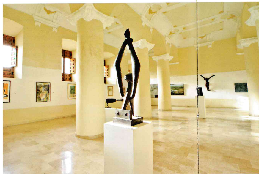
Museos, Monasterio de Nuestra Señora de la Merced, Huelva