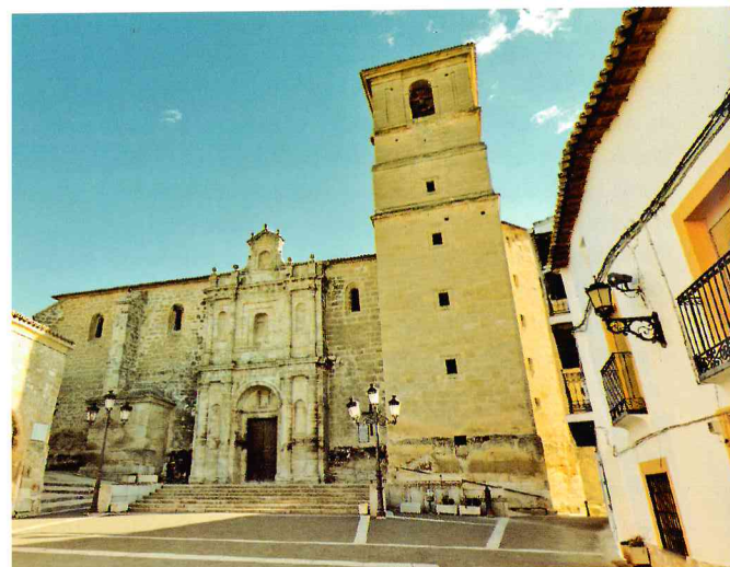
Iglesia parroquial de la Asunción y embalse de Buendía

Sus alrededores parecen inventados para el senderismo. Un itinerario sencillo y sorprendente es la Ruta de las Caras, que recorre un camino repleto de esculturas de grandes dimensiones labradas en la roca.