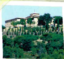
Convento de San Miguel

Se afronta después una empinada ladera pedregosa por una senda estrecha para bajar de nuevo al valle. Antes de llegar al pueblo, podemos desviarnos hasta el Convento de S. Miguel de las Victorias (S. XVI), ya en el interior del Estrecho de Priego .