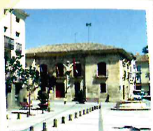
Ayuntamiento de Priego

Priego, situado en el extremo Noreste de La Alcarria Conquense, es limítrofe con el Parque Natural Serranía de Cuenca.