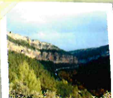
Estrecho de Priego

Además de los atractivos naturales es un vecindario cargado de historia. Su Iglesia, palacios, casas señoriales, construcciones religiosas y arquitectura popular, así como su industria artesanal hacen de Priego un importante destino para el viajero.