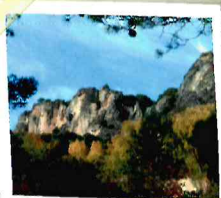
Estrecho de Priego

Este sendero afronta importantes pendientes para subir a las zonas altas de las sierras que flaquean el Valle de Priego por el Este.