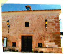
Ermita de la Soledad, Torrejoncillo

El recorrido circular supone un viaje por la tradición y la historia de este rincón entre La Alcarria Conquense y La Mancha de Cuenca y asomarnos a su territorio.