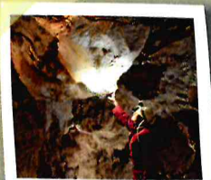
Mina de la Mora Encantada

La visita a la mina de la Mora Encantada es la mejor apuesta para finalizar la jornada. Este yacimiento, explotado en época romana para la extracción de lapis specularis (variedad de yeso selenítico utilizado como cristal para ventanas y vidrieras), está catalogado como Lugar de Interés Geológico (LIG) y precisa de cita previa para su visita (Tel.: 669718762 / 969278007).