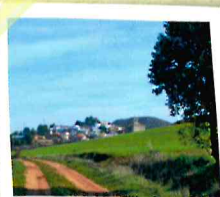
Horcajada de la Torre

Para finalizar la jornada se propone la visita a la mina romana de la Mora Encantada antes de entrar en Torrejoncillo del Rey.