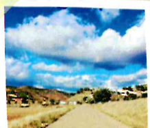
Torrejoncillo del Rey

Este es un trazado circular entre las localidades de Torrejoncillo del Rey y Horcajada de la Torre.