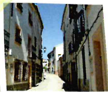
Calle de Valdeolivas

Entramos en Valdeolivas por el Arco de Molina, parte de la antigua muralla medieval, y por la calle Resa y Coronel llegamos a la Plaza Vieja. El punto de inicio está próximo en la Puerta de Huete.