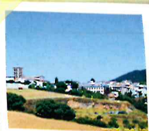
Panorámica de la población

Valdeolivas, está ubicada en una amplia depresión que abarca poblaciones de Cuenca y Guadalajara, conocida como la Hoya del Infantado. El clima y el suelo favorecen la producción de aceite de la variedad verdeja, de gran calidad y muy apreciada.