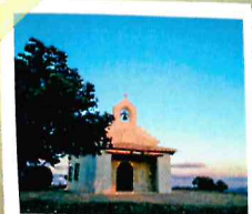
Ermita de San Quirico y Santa Julita

Por las calles Ronda y S. Roque se abandona el pueblo hacia el norte entre tierras de labor, para iniciar una subida de 2 km y casi 200 m de desnivel. A media ladera tomamos una senda que sube al cerro San Quílez donde se encuentra la ermita de S. Quirico y Sta. Julita, mirador