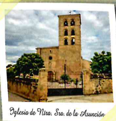
Iglesia de Nra. Sra. de la Asunción

Su conjunto urbano aún conserva el sabor medieval en sus plazas e intrincadas calles, casas señoriales y en la arquitectura popular de la que hace alarde. La iglesia parroquial de Nuestra Señora de la Asunción fue construida entre los siglos XII-XIII y catalogada Bien de Interés Cultural en 1982. Mezcla el estilo románico de la nave central y su inconfundible torre con una muestra bien conservada de las primeras manifestaciones de estilo gótico en la única nave lateral que se conserva.