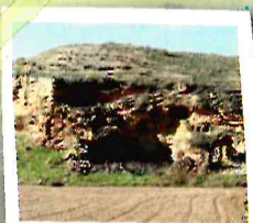
Cuevas vivienda escavadas

En algún momento este valle fue una zona húmeda de extensos lagos, cuyos petrificados fondos sedimentarios han quedado a la vista en muchas zonas, como agrietadas y rasgadas rocas redondeadas.