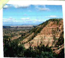
Valle del Guadamejud

El itinerario nos permite conocer algunos vecindarios del corazón de La Alcarria Conquense, que aún conservan su arquitectura rural y forma de vida tradicional.