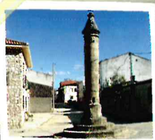
Picola en La Ventosa

Es un recorrido longitudinal que llega a todas las villas que forman el municipio, cuya dificultad sólo radica en su longitud. Desde La Ventosa, hasta Villarejo del Espartal, pasa por Culebras, Valdecañas, Bólliga y Fuentesbuenas.