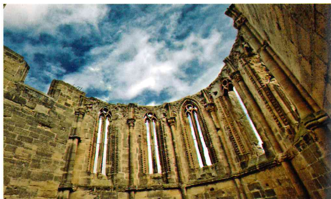
Ábside de Santa María de Atienza, Huete

El ábside de Santa María de Atienza de Huete data del siglo XIII y es una singular muestra arquitectónica del estilo gótico