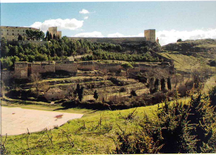
Castillo amurallado de Uclés

A 15 kilómetros por la CUV-7021, está Carrascosa del Campo , donde hay que ver la iglesia de Nuestra Señora de la Natividad. Posee una preciosa portada plateresca y otra de estilo gótico isabelino que dan acceso a un elegante y simétrico anterior donde hay un Amarrado a la Columna atribuido a Salzillo.