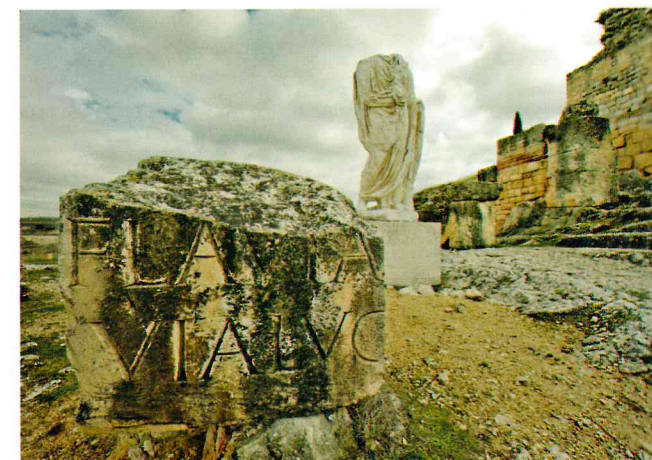
Detalle del teatro romano, Segóbriga

A unos pasos de la moderna civilización que encarna la Autovía A-3 encontrará el viajero Segóbriga , en el término municipal de Saelices, del que se ha dicho que es uno de los parques arqueológicos más completos de la Península. Una definición suficientemente elocuente de su valor y atractivo. Su origen está en la Edad de Bronce y en tiempos cristianos fue cabeza de un Obispado visigótico, pero es en la época romana cuando alcanza su esplendor como centro urbano de la actividad económica y social que se generó en torno a las minas de lapis specularis de la zona.