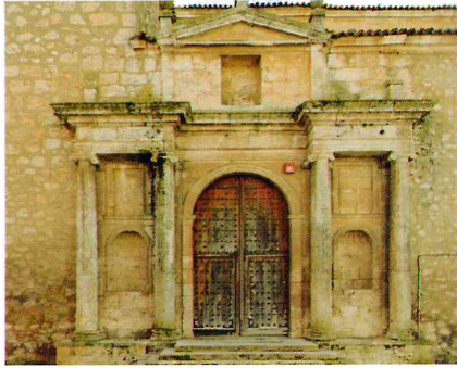
Iglesia Nuestra Señora de la Asunción, Tarancón

El Retablo Mayor de Tarancón es un soberbio ejemplo del plateresco con más de 15 metros de altura