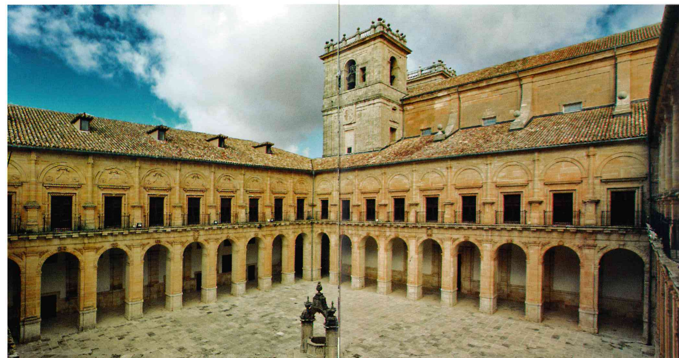
Claustro del monasterio de Uclés

El patio: un doble claustro con 36 arcadas de medio punto. El refectorio cuenta con un magnífico artesanado de medio punto y el zaguán alberga excelentes pinturas.