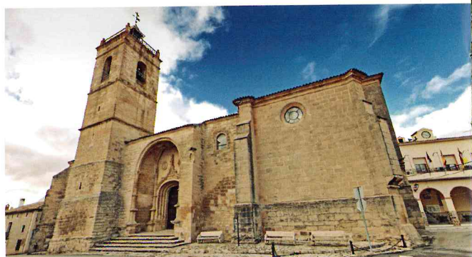
Iglesia de Nuestra Señora de la Natividad, Carrascosa del Campo

Doce minutos en coche separan la localidad de Huete si se circula por la CM-310. Un conjunto único repleto de conventos, iglesias, palacios y ermitas. La piedra hecha creatividad y solemne presencia.