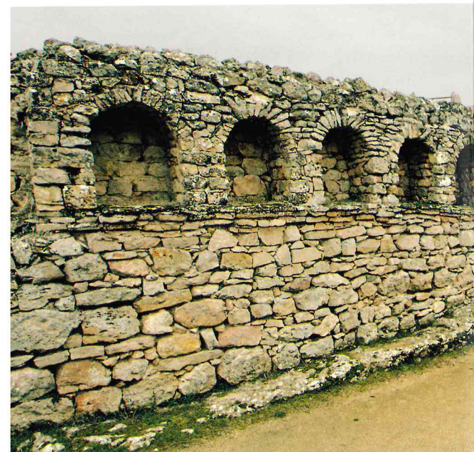
Termas públicas, Segóbriga