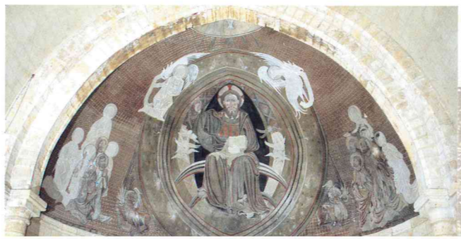
Pantocrátor de la Iglesia de Nuestra Señora de la Asunción