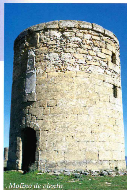
Molino de viento

En el noroeste de la provincia de Cuenca, al límite con la de Guadalajara, Valdeolivas, destaca majestuosamente al aproximarse desde Priego. Emplazándose, en un altozano de la cuesta de la Sierra, recorta su silueta en el horizonte alcarreño.