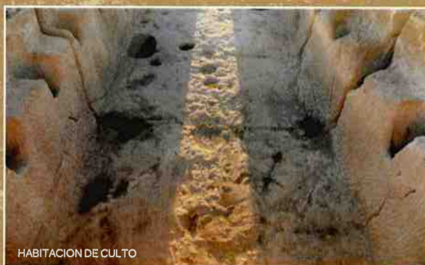
HABITACION DE CULTO

El Foso, que encontramos en la parte más baja del yacimiento, tiene 70 metros de largo y 4 metros de alto en la parte más alta.