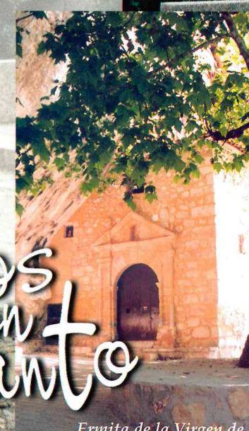
Ermita de la Virgen de