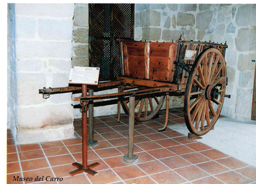
Museo del Carro

Las fiestas de Buendía se viven en torno a la Virgen de los Desamparados . El segundo fin de semana de mayo se lleva a la Virgen en procesión desde la ermita hasta la iglesia, para luego devolverla el primero fin de semana de septiembre. Verbenas, encierros y atracciones alegran las calles de Buendía en estas fechas.