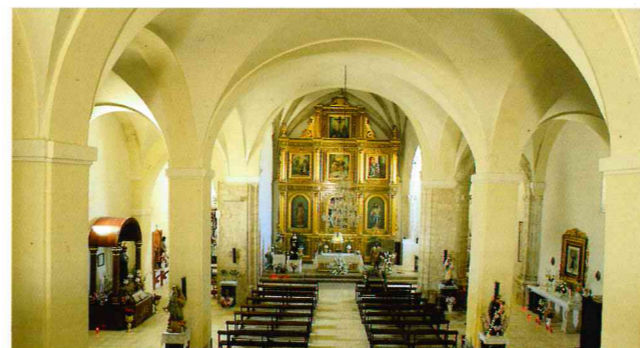
Iglesia Parroquial de San Juan Bautista