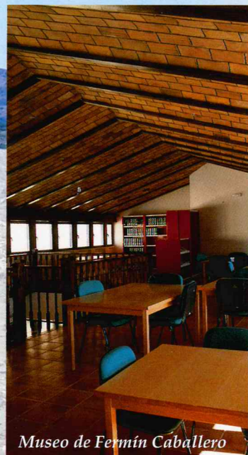
Museo de Fermín Caballero