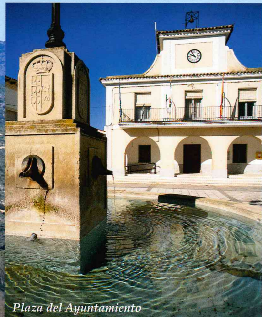
Plaza del Ayuntamiento