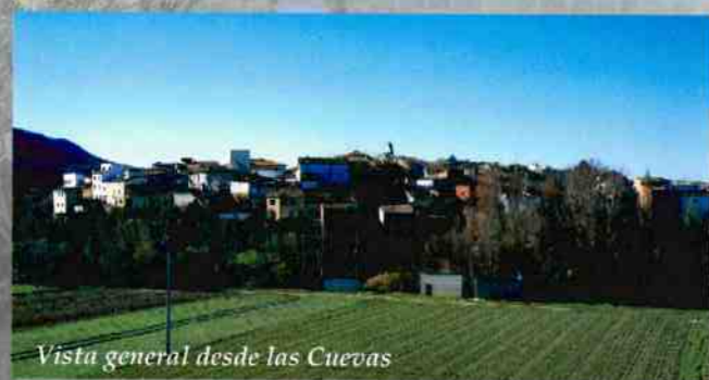
Vista general desde las Cuevas