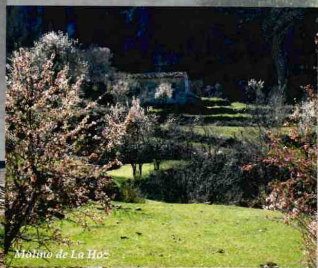
Molino de La Hoz