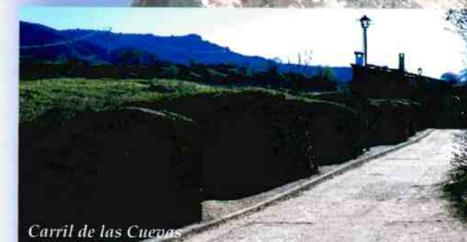
Carril de las Cuevas