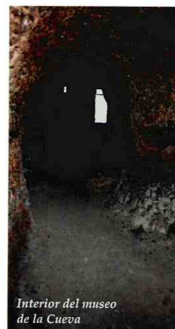
Interior del museo de la Cueva