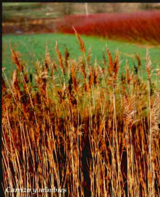
Crecen y mimbres