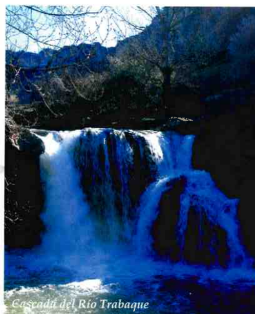
Cascada del Río Trabaque

Albalate, "camino empedrado" según la etimología árabe haciendo referencia a la antigua calzada romana que transcurría por su término municipal, y de las Nogueras , por la abundancia de este árbol en otros tiempos, es un bello pueblo alcarreño de la provincia de Cuenca que se asienta, en una pequeña ondulación del terreno, asomándose a la fresca ribera del río Trabaque.