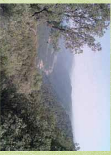
Valle del Río de la Vega cerca de Jabalera. Sierra de Almonita.

La declaración de un espacio Red Natura 2000, tanto si es Z.E.P.A. como si es L.I.C. y posteriormente Z.E.C. no tiene por qué afectar a las actividades tradicionales que se han desarrollado en ese espacio. La idea con la que surge Natura 2000 es la de proteger los valores naturales, especies silvestres y hábitat que en muchos casos han sido mantenidos por una actividad humana tradicional realizada durante siglos. Por tanto, la declaración de un espacio como Natura 2000 no compromete los usos agrarios o ganaderos tradicionales del mismo.