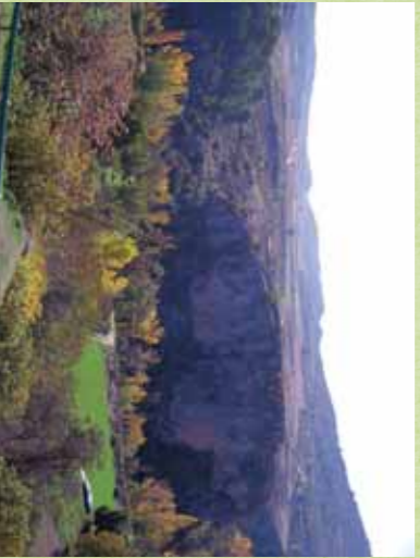
Zona protegida del Valle del Río Escabas. Priego

Las actuaciones que pueden crear conflictos con la Red Natura 2000 son algunas de las no consideradas tradicionales del territorio en cuestión, que por tanto supondrán un impacto para la conservación de los valores naturales que se quieren proteger. En cualquier caso la realización de dichas actividades siempre