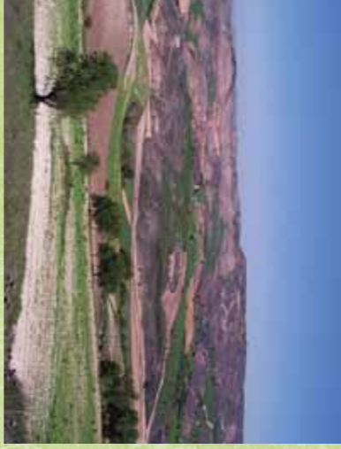
Estepas yososas de La Alcarria Conquense desde el Valle del Río Mayor. Huete.

Las actuaciones que pueden crear conflictos con la Red Natura 2000 son algunas de las no consideradas tradicionales del territorio en cuestión, que por tanto supondrán un impacto para la conservación de los valores naturales que se quieren proteger. En cualquier caso la realización de dichas actividades siempre