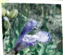
Gran variedad biológica

Desde el pueblo, salimos por el camino que nos lleva al Hoyo Redondo peculiar "Torca" o hundimiento del terreno que deja ver los estratos rocosos.