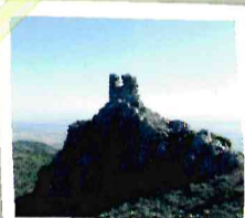
Antiguos restos de una torre

El regreso inicialmente lo haremos por el mismo camino, para tomar una nueva senda que baja hacia el pueblo, donde llegamos por el conocido como Camino de Morata .