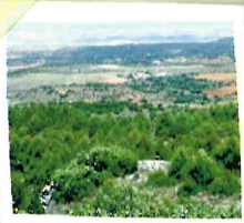
Entorno de Saceda Trasierra

Un sendero que se desarrolla en pleno corazón de la Sierra de Altomira, sobre la vertiente Oeste, poblada de encinas, robles e innumerables plantas aromáticas que en primavera crean un manto de color y aromas naturales a lo largo de todo el recorrido, desde su inicio en el vecindario de Saceda Trasierra.